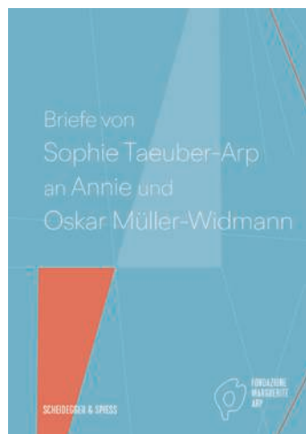
Zurich : Scheidegger & Spiess, 2021, 144 pages