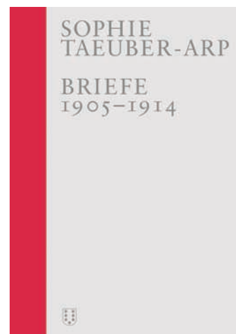
Wädenswil (Suisse) : Nimbus. Kunst und Bücher AG, 2021, 3 vol., 1832 pages